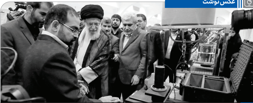
بازدید رهبر انقلاب از نمایشگاه شرکتهای دانش بنیان و فناوریهای برتر | ۱۳۹۸/۷/۱۶