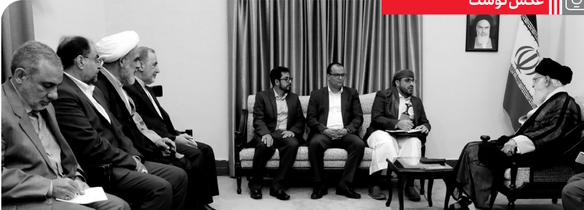
تصویری از مرحوم حسن ایلرو، در دیدار سخنگوی جنبش انصارالله یمن با رهبر انقلاب، ۱۳۹۸/۵/۲۲