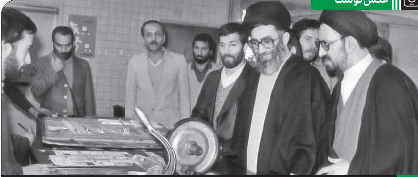
بازدید آیت‌الله خامنه‌ای از روزنامه و چاپخانه اطلاعات در تاریخ ۱۳۶۳/۹/۲۰

هرکس - حتی خود امیرالمؤمنین علیه السلام - هم اگر به جای امام حسن مجتبی علیه السلام بود و در آن شرایط قرار میگرفت، ممکن نبود کاری بکند، غیر از آن کاری که امام حسن کرد. هیچ کس نمیتواند بگوید که امام حسن، فلان گوشه‌ی کارش سؤال برانگیز است. نه، کار آن بزرگوار، صد درصد بر استدلال منطقی غیر قابل تخلف منطبق بود. در بین آل رسول خدا ﷺ، پُرشورتر از همه کیست؟ شهادت‌آمیزترین زندگی را چه کسی داشته است؟ غیرتمندترین آنها برای حفظ دین در مقابل دشمن، برای حفظ دین چه کسی بوده است؟ حسین بن علی علیه السلام بوده است. آن حضرت در این صلح، با امام حسن علیه السلام شریک بودند. صلح را تنها امام حسن نکرد؛ امام حسن و امام حسین علیه السلام این کار را کردند. ● ۱۳۷۵/۳/۲۰ | ۷ صفر، سالروز شهادت امام حسن مجتبی علیه السلام تسلیت باد