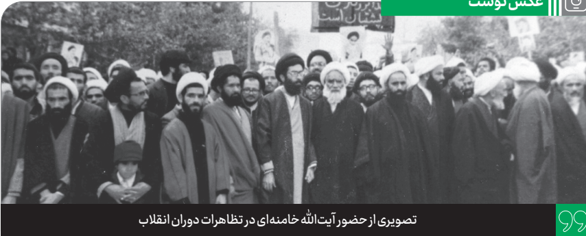
تصویری از حضور آیت الله خامنه ای در تظاهرات دوران انقلاب